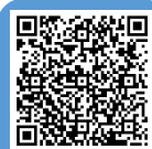
参加登録フォーム

必要事項を記入の上、以下フォームより申してください。 申込フォームが開きます 参加申込登録フォーム： https://forms.office.com/r/tQVJJiGeUX